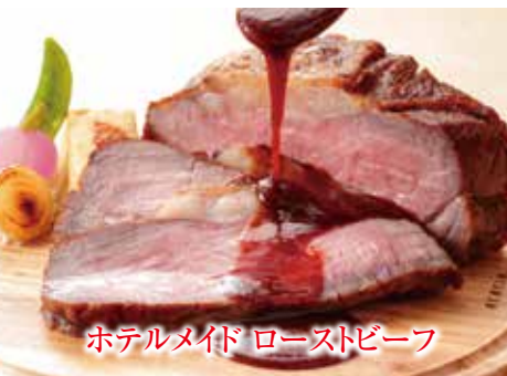
ホテルメイド ローストビーフ