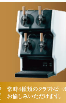
新潟市内ホテル初登場!クラフトビールが毎日飲める KIRINタップマルシェを導入! 常時4種類のクラフトビールをお楽しみいただけます。